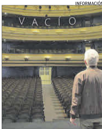
Carteles del corto Vacío y de la película Mirando al mar .